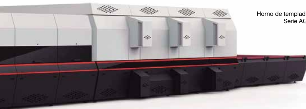
Horno de templado Serie AG.