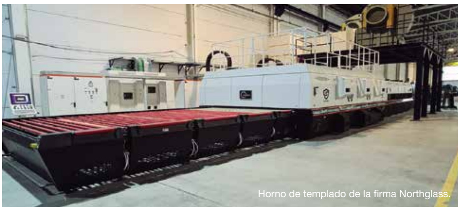
Horno de templado de la firma Northglass.

Northglass y una línea de canteadoras bilaterales de alta producción, ambos equipos distribuidos por Sistemas Sitec .