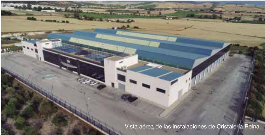
Vista aérea de las instalaciones de Cristalería Reina.